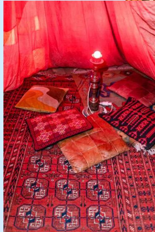
A Tent for Storytelling, Secrets and Kissing, 2022 Stoffzelt Stoffreste, Hula Hoops, diverses Material 270 x 240 x 240 cm