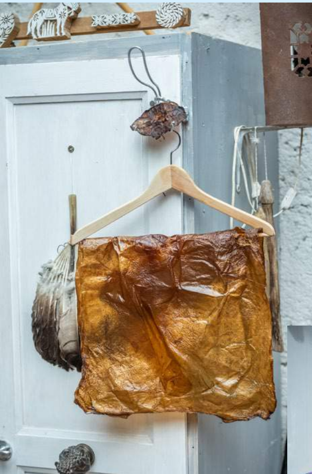
← Kombuchaleder Getrockneter Komuchapilz 40 x 80 cm By Hackteria